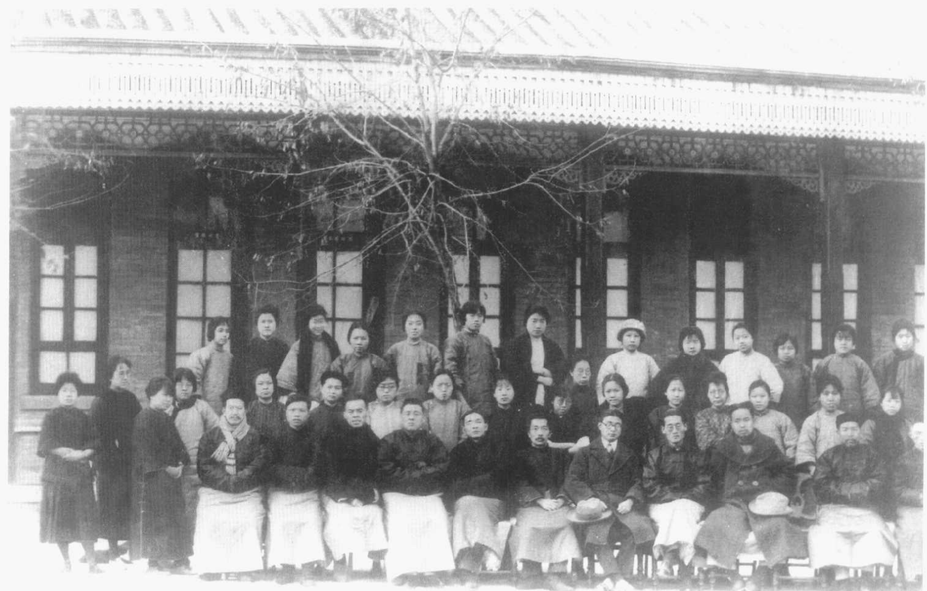
在西安讲学时合影（1924）