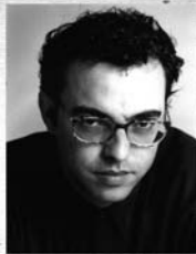
Sergi Belbel (1963)

Nació en Terrassa (Barcelona). Estudió Filología Románica y Francesa en la Universidad Autónoma de Barcelona y es miembro fundador del Aula de Teatro de esa universidad. Desde 1988 es profesor de Dramaturgia en el Institut del Teatre y desde enero de 2006, el responsable artístico del Teatro Nacional de Cataluña.