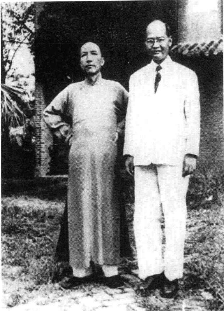
陳寅恪先生(左)與王力先生在廣州嶺南大學校內合影